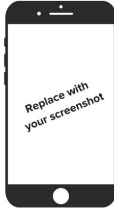
Step 5: (fill in description)