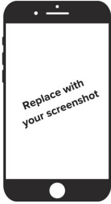
Step 4: (fill in description)