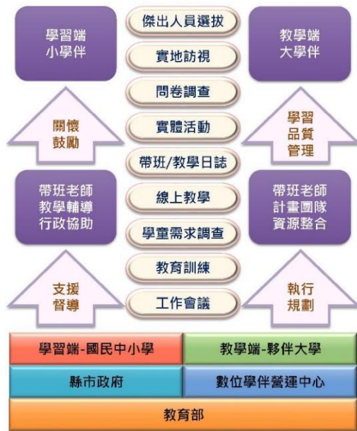
【圖 2 數位學伴計畫執行團隊運作架構】