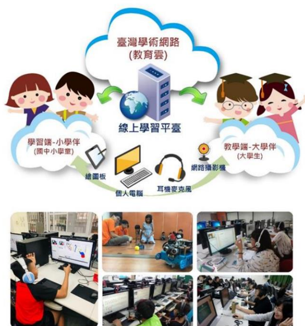
【圖 1 數位學伴計畫線上環境與設備架構】

以大學學伴制為概念，招募、培植大學生擔任偏遠地區國民中小學/DOC 學童之學伴，藉由視訊設備與線上學習平臺，讓教學端(大學生)與學習端(國民中小學/DOC 學童)以定時、定點、集體(集中於學校電腦教室)方式，每週 2 次(每次 2 堂課，每堂課 45 分鐘)，進行一對一線上即時陪伴與學習，提供資訊應用及學習諮詢。