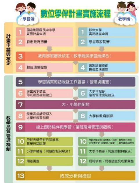
【圖 3 數位學伴計畫實施流程】