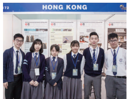
香港 Hong Kong