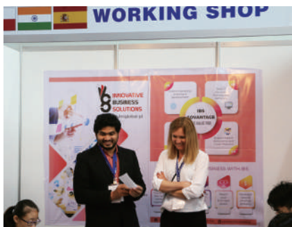
印度 India + 西班牙 Spain